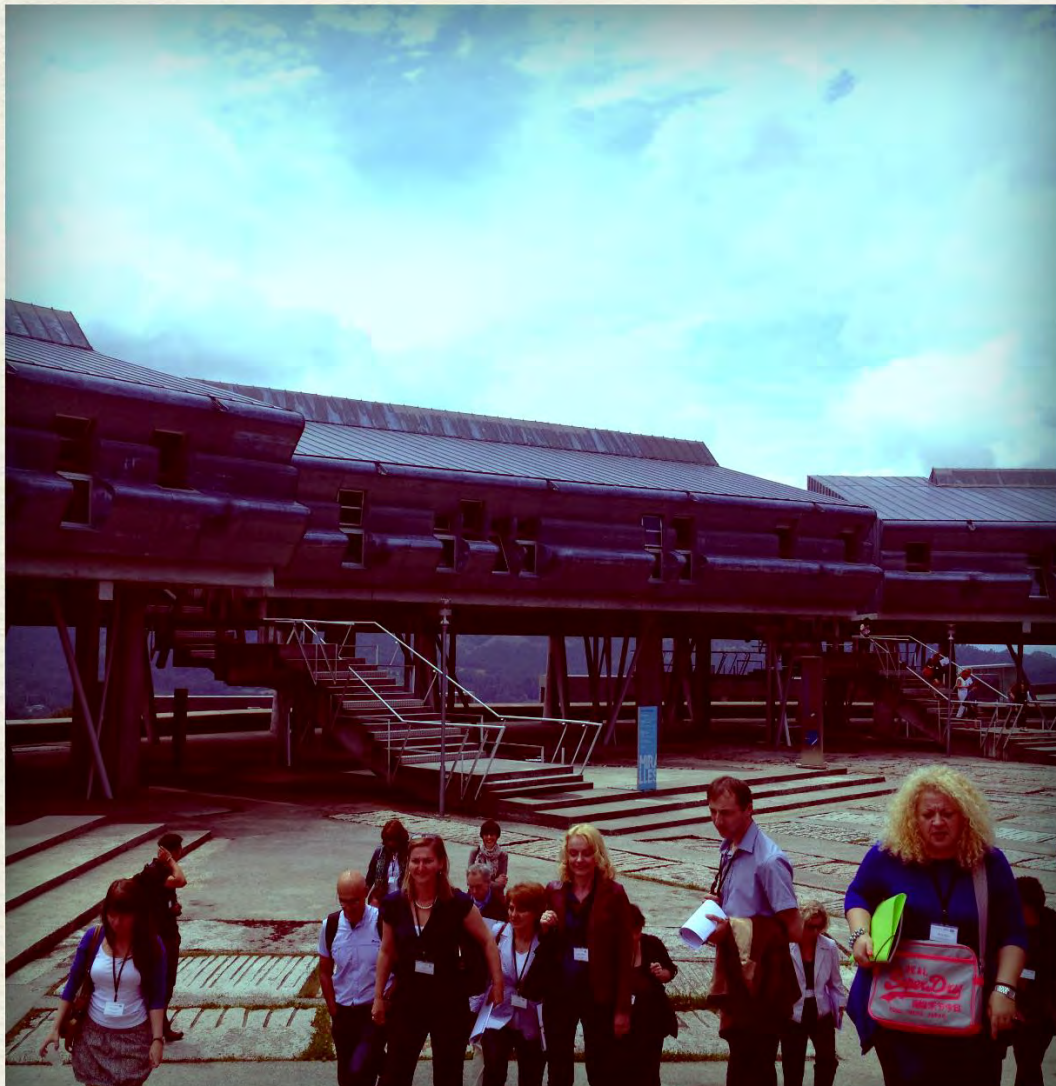
Universida deVigo/Spanien Campus

Insgesamt 62 Teilnehmer*innen aus 15 Nationen haben sich in verschiedenen Panels zum Thema „ Multilingual Universities: Preparing EU Citizens for a Global Society “ ausgetauscht.