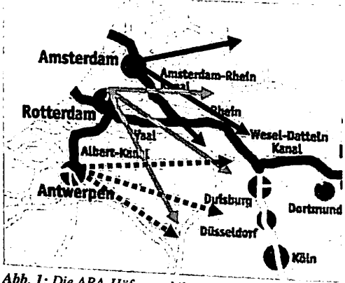
Abb. 1: Die ARA-Häfen und ihr Einzugsgebiet.

Grundlegend für die Betrachtung der Bemühungen um die West-Ost-Magistrale „Rhein-Maas-Schelde-Kanal“ sind daher die Wechselwirkungen zwischen dem Seeverkehr und seinen Stützpunkten einerseits und dem binnenländischen Warentransport andererseits. Die Entwicklung der als ARA-Häfen bezeichneten Hafenplätze Amsterdam, Rotterdam und Antwerpen ist bei der Diskussion von Verkehrsverbindungen in der Rhein-Maas-Region darum vordringlich zu berücksichtigen. Zu betonen ist hier die Doppelfunktion derjenigen Seehäfen, die über eine effektive Anbindung an das binnenländische Wasserstraßennetz verfügen, die beiden niederländischen Häfen erfüllen dieses Kriterium. 4 Der Rhein als Verkehrsader kann in Verbindung mit seinen bedeutenden Umschlagplätzen hierbei als das Rückgrat nicht nur der westdeutschen, sondern auch der westeuropäischen Wirtschaft mit bedeutenden Auswirkungen auf die ökonomischen Verflechtungen in dieser Region betrachtet werden. 5